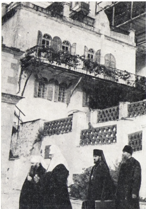
Святейший Патриарх Московский и всея Руси Пимен с русскими паломниками у Покровского корпуса в Русском Пантелеимоновом монастыре 25 октября 1972 года

Вздорность этих «опасений» очевидна. Это лишь предлог для проведения вполне определенного политического курса. Хотя ратифицированная в 1923 году в Лозанне статья 13 Севрского договора 1920 года между союзниками и Грецией оставляла неизменным статус национальных меньшинств на